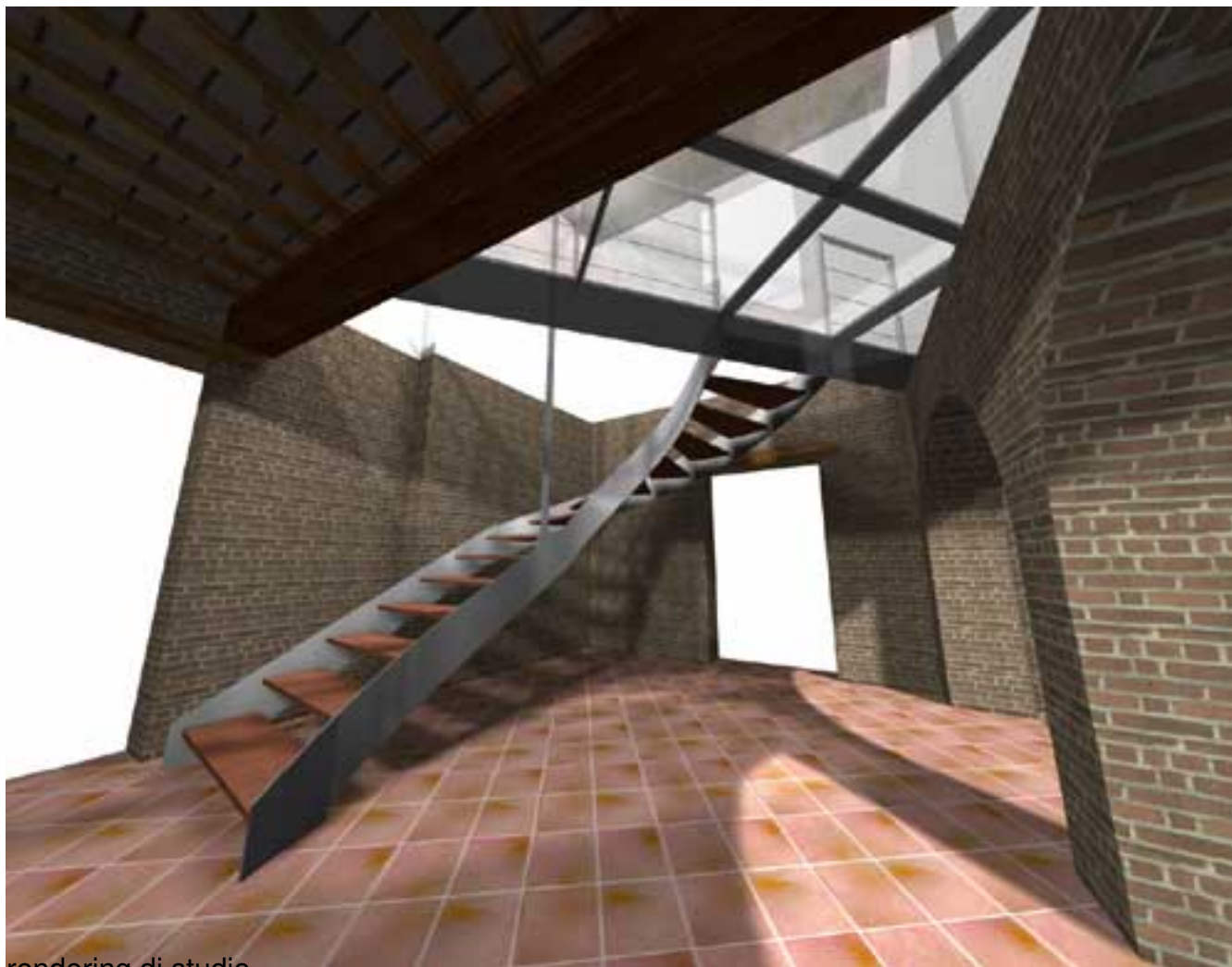
rendering di studio

Giovedì 02 Agosto 2007 16:01 - Ultimo aggiornamento Venerdì 16 Novembre 2007 11:14