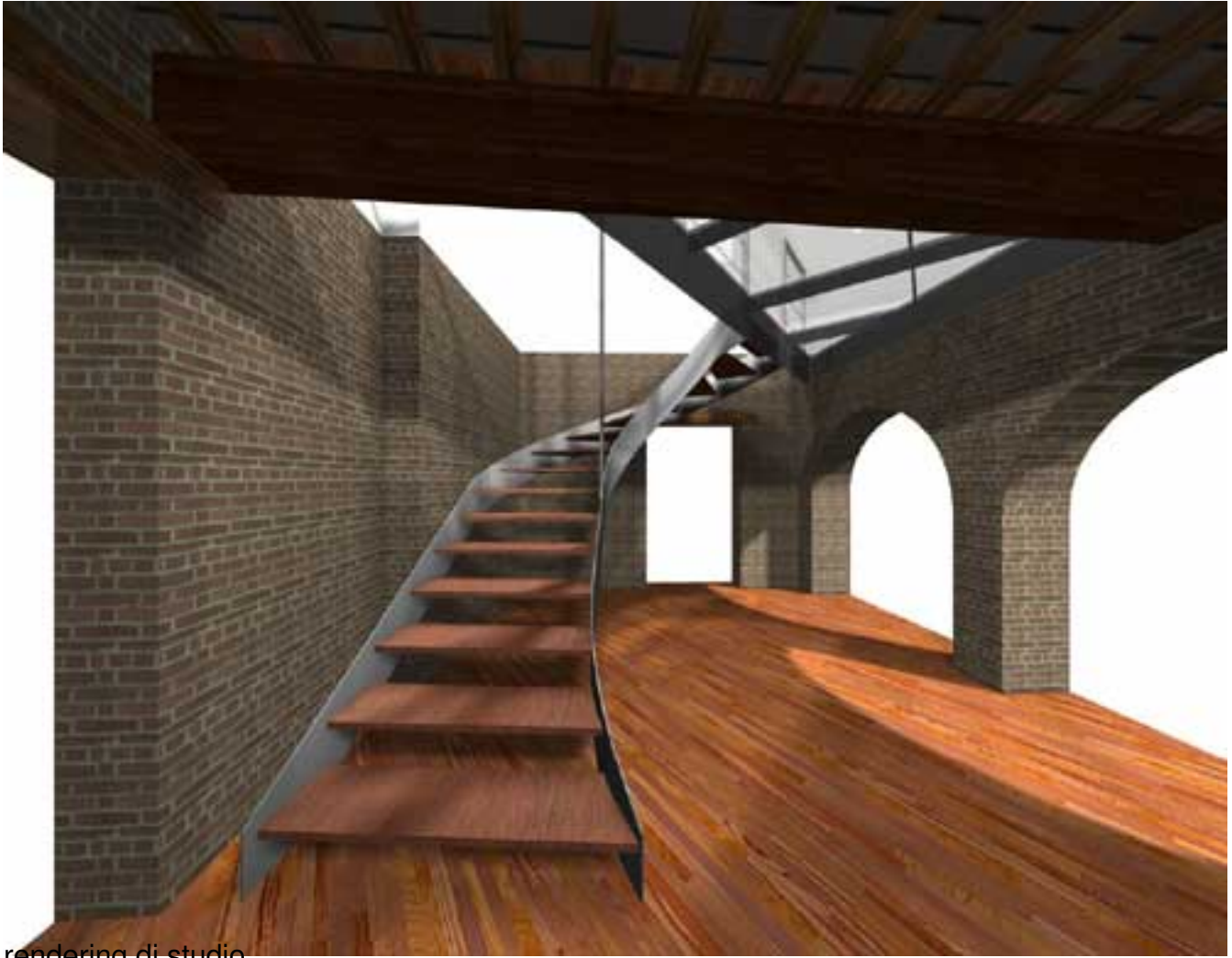
rendering di studio

Giovedì 02 Agosto 2007 16:01 - Ultimo aggiornamento Venerdì 16 Novembre 2007 11:14