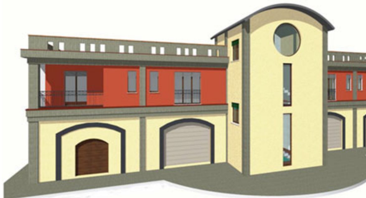
Copertura ad arco durante la fase di realizzazione