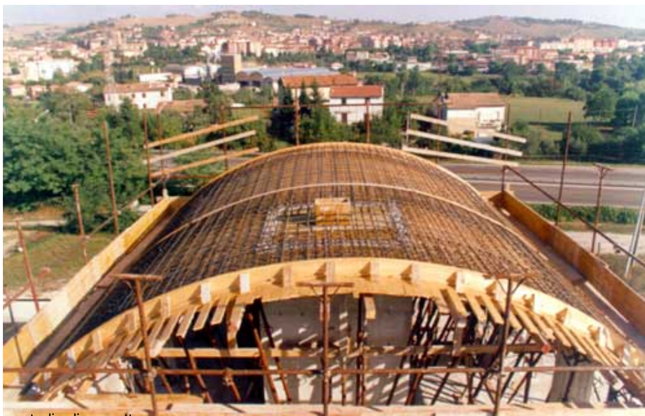
studio di progetto

Martedì 19 Dicembre 2006 17:43 - Ultimo aggiornamento Venerdì 17 Ottobre 2014 11:14